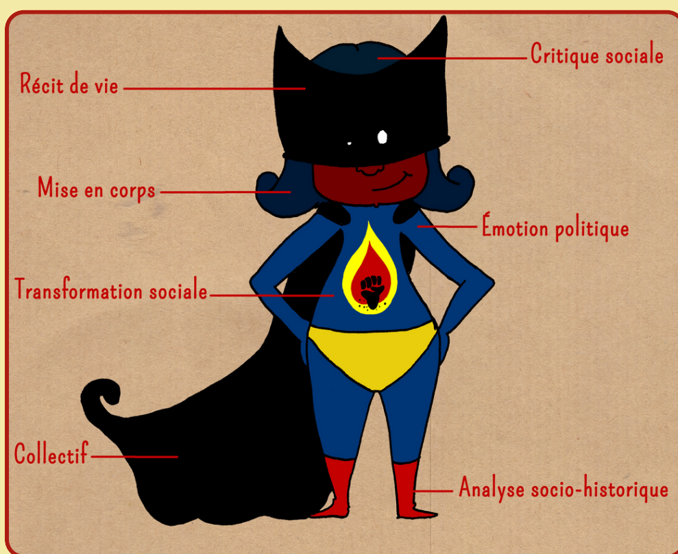
Illustration de Lucy Nuzit